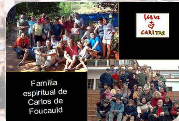
Familia espiritual de Carlos de Foucauld

El 1 de diciembre de 1916 cae asesinado por un grupo de rebeldes. Dirán los tuaregs: "Carlos no ha muerto sólo para ustedes, ha muerto también para todos nosotros."